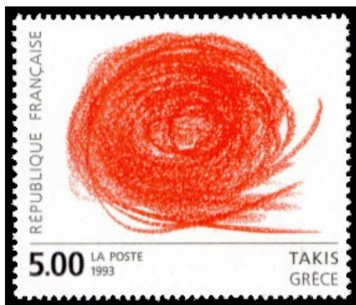
Vassiliakis Takis, 1992.

La Journée de l'Europe peut être l'occasion d'entrées multiples en histoire de l'art selon les projets de la classe : une entrée par des artistes de l'Union européenne, par des créations liées à certaines étapes de la construction européenne et même par le mythe d'Europe , princesse de la mythologie grecque.