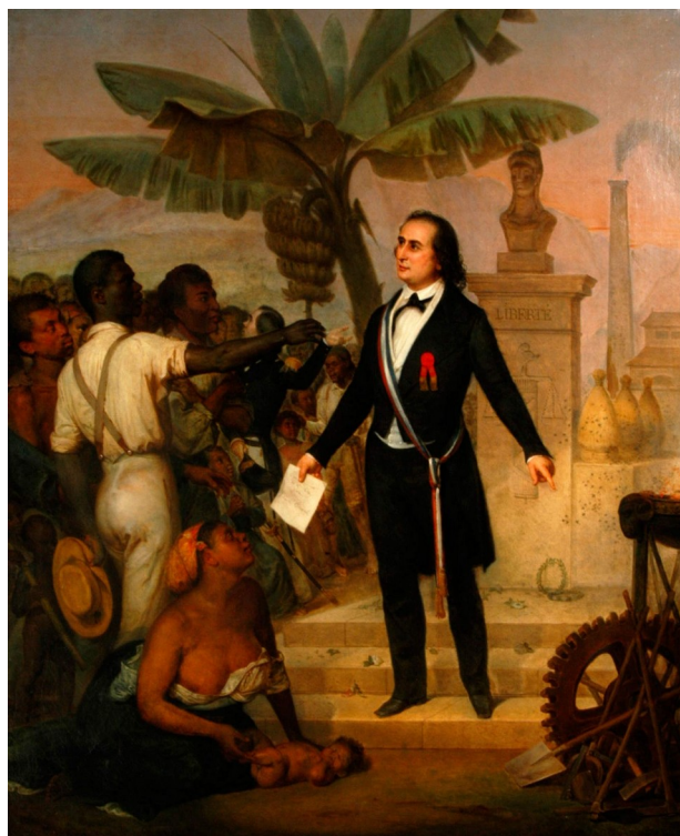
Alphonse Garreau, Proclamation de l'abolition de l'esclavage à La Réunion , 1848.

Le 10 mai est une journée spécifiquement française pour la commémoration de l'esclavage. Sont proposées ci-dessous deux oeuvres de l'époque de l'abolition de l'esclavage par l'État français et une œuvre contemporaine de Jean-Michel Basquiat sur la représentation d'un marché aux esclaves.