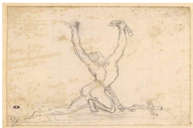
Pierre-Jean David d'Angers, Abolition de l'esclavage , XIX ème siècle.