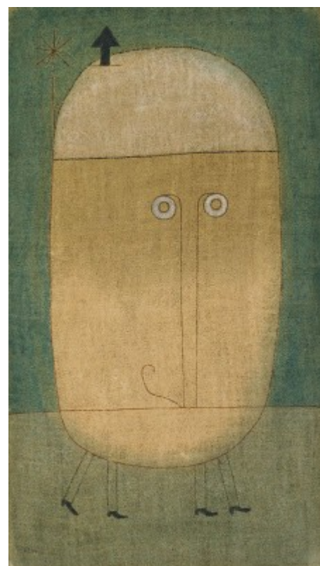
Paul Klee, Masque de peur , 1932.