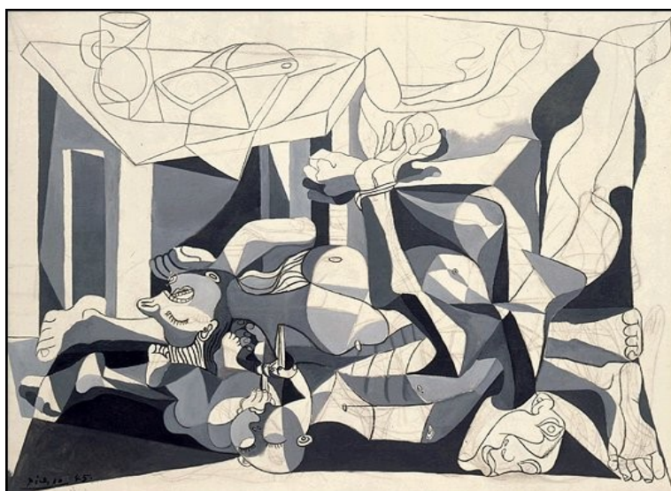
Pablo Picasso, Le charnier , 1944-45.