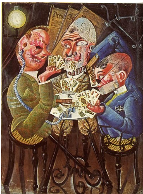
Otto Dix, Les Joueurs de skat/Invalides de guerre jouant au skat , 1920.

Les œuvres d'Otto Dix, peintre allemand contemporain des deux guerres mondiales, sont des entrées intéressantes pour aborder le conflit de 1914-1918 et ses conséquences. Otto Dix est, en effet, très connu – et reconnu – pour ses représentations de la guerre et de ses effets sur les corps des soldats.