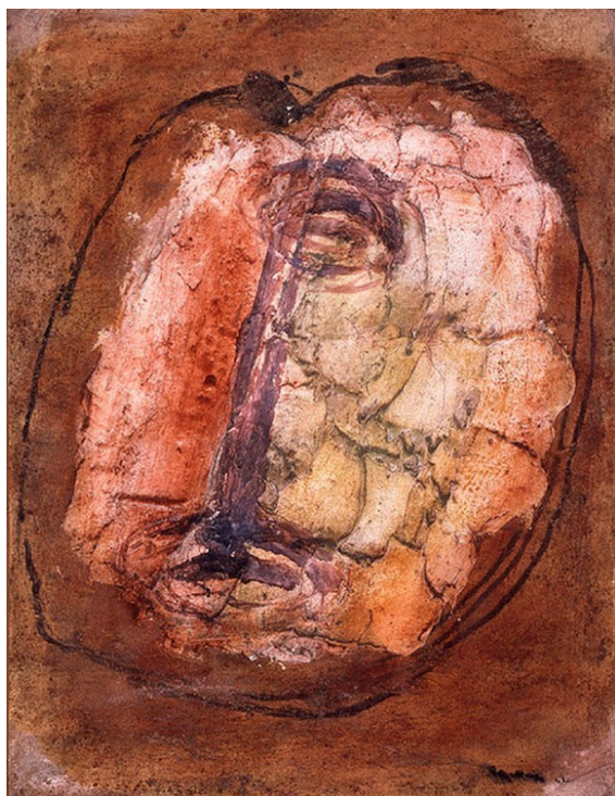
Jean Fautrier, Tête d'otage n°1 , 1943.

Jean Fautrier évoque des otages dans sa série de têtes semi abstraites ; Pablo Picasso représente un charnier avec des corps disloqués comme dans son chef-d'oeuvre de 1937, Guernica , sur la guerre d'Espagne ; en 1949, sa colombe devient un symbole de paix.