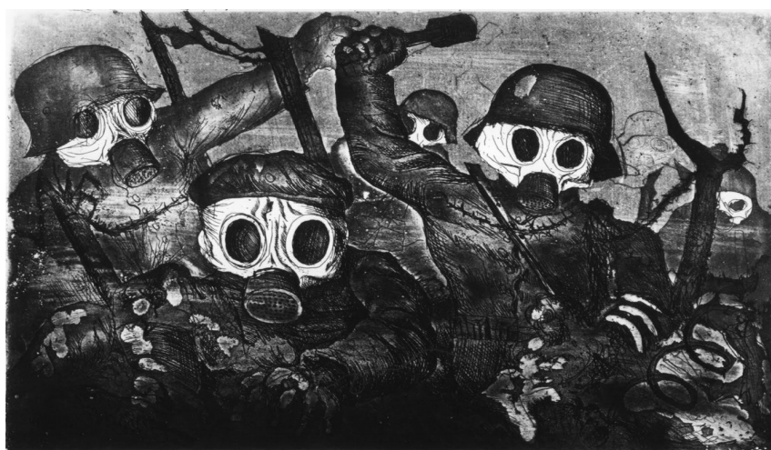
Otto Dix, Assaut sous les gaz , 1924.