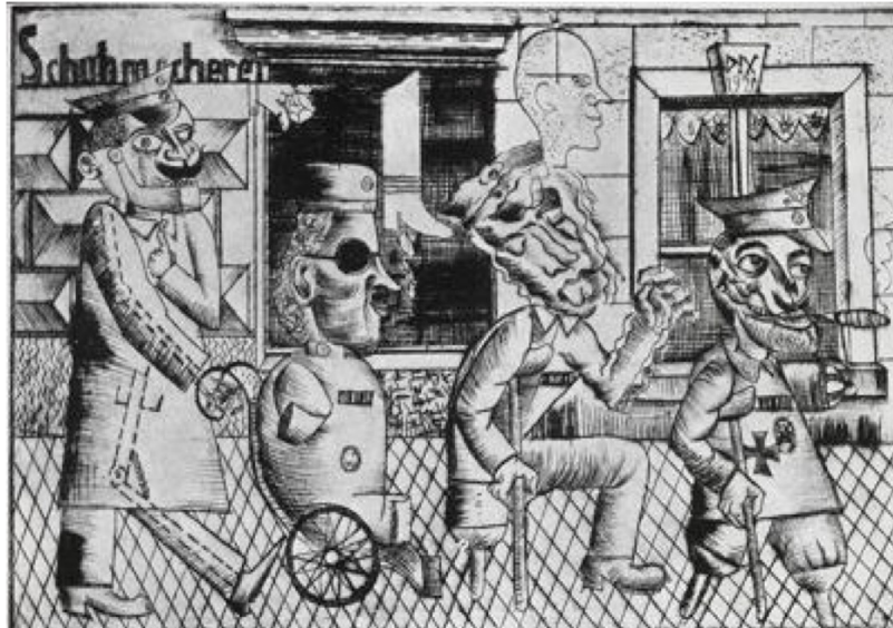
Otto Dix, Les estropiés de la guerre (War cripples) , 1920.