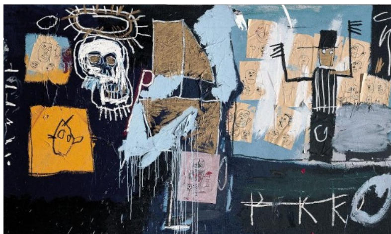
Jean-Michel Basquiat, Slave auction