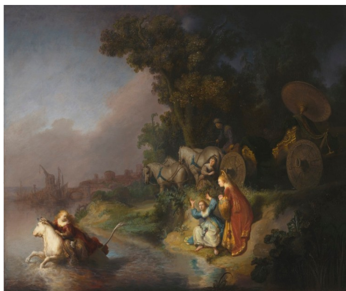
Rembrandt, L'enlèvement d'Europe, 1632.